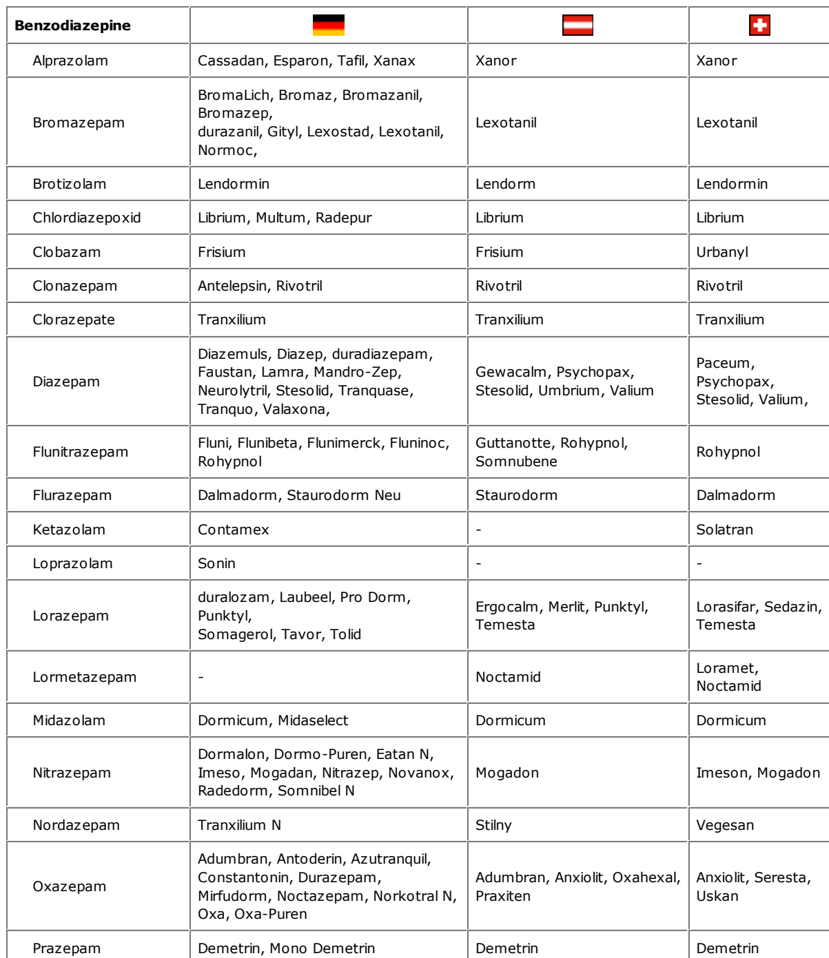
Tabelle 14. HANDELSNAMEN IN DEUTSCHSPRACHIGEN LÄNDERN

5. Durch langsame Entwöhnung, wie oben dargestellt, kommt es in der Regel nicht zu Entzugs-Symptomen von Antidepressiva, und wenn sie erscheinen, sind sie leicht und kurzlebig.